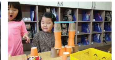
쌓은 컵 위에 막대를 올려 보기도 한다.