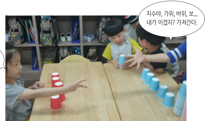
지수야, 가위, 바위, 보... 내가 이겼지? 가져간다.