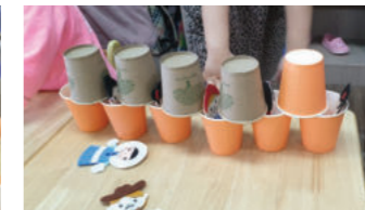
종이컵을 쌓아 보고