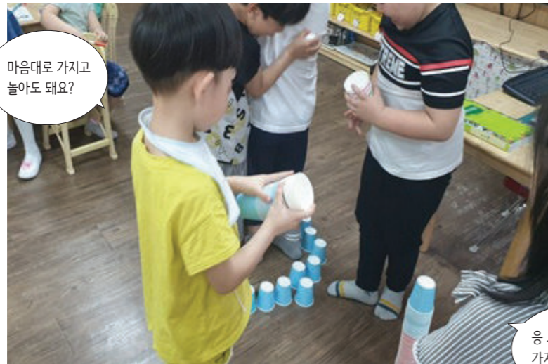
마음대로 가지고 놀아도 돼요?

옆 반인 파란반 교사는 유아가 수·조작 공간에서 종이컵으로 다양하게 놀이하는 모습을 보고 흥미로움을 느꼈다. 종이컵 놀이가 어떻게 변해갈지 기대가 생겨 다양한 종류의 종이컵을 교실 전체에 제공하였다.