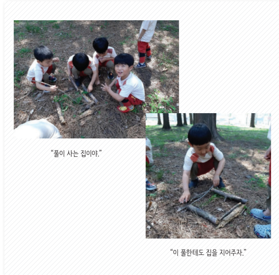
“풀이 사는 집이야.”

유아들은 나뭇가지를 활용하여 모양을 만들었다. 나뭇가지를 길게 이어놓기, 쌓아놓기 등 다양한 방식으로 모양을 만들었지만, 주로 네모난 폐쇄공간을 만들었다.