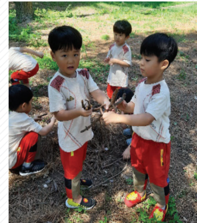
“이게 제일 짧고, 이게 제일 커.” “여기는 애기 나뭇가지만, 여기는 어른 나뭇가지들만 있어.” “나뭇가지 하나, 둘, 셋, 넷, 다섯 개!”

숨바꼭질을 하지 않고 자유롭게 숲을 거닐던 다른 유아들이 바닥에 떨어진 나뭇가지를 발견하였다.