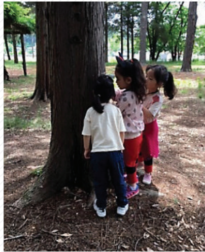
“나무에 뭐가 있어.” “움직여. 벌레인가 봐.”

유아들은 사냥꾼을 피해 숨은 숲 속 곳곳에서 제각각 무엇인가를 발견하고 탐색하느라 바빴다.