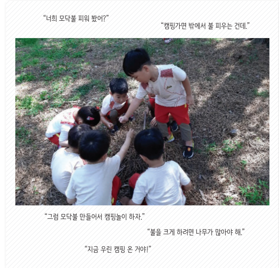
“너희 모닥불 피워 봤어?”