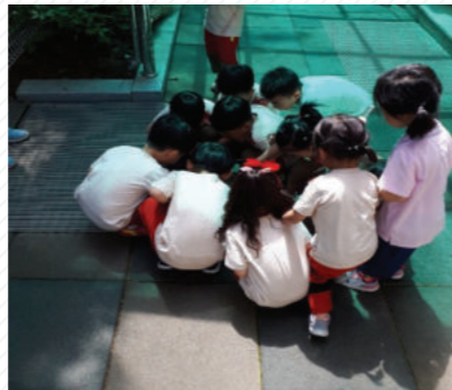
“야, 이리 와봐! 여기도 뭐 있다.” “뭐야?”